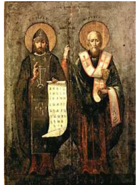
Кирилл (ок. 827—869) 98 и Мефодий (ок. 815 или 820— 885) Настоящие Люди

По-гречески – “Любовь” – так будет – “Фило”, А “софия” – на русском языке Звучит, как – “Мудрость”. Как, - (вы не забыли?) Два светлых слова слить в одной строке?