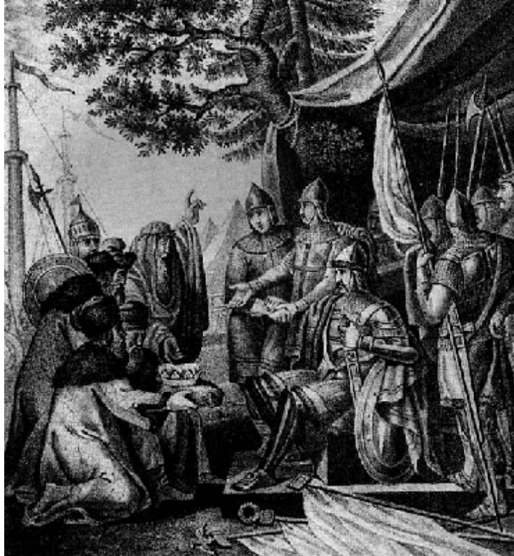
Рюрик Синеус и Трувор принимают послов славянских, призывающих на княжение (гравюра середины XIX в.)

Послала Русь послов к “врагам” – “варягам”, - 83 Придите, правьте. (Хоть “воряга” – “вор”) И прибыли на Русь, сменивши флаги, Три брата: Рюрик, Синеус, Трувор.