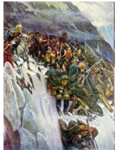
Суриков. «Переход Суворова через Альпы». Вдохновляет мужчин завода «Электрон» на трудовые подвиги.