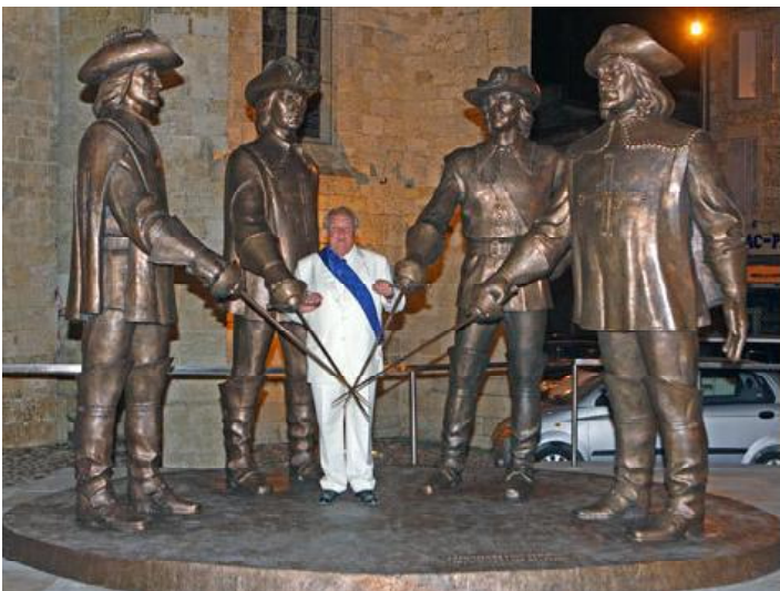
Московский Комсомолец № 25449 от 14 сентября 2010 г.

Вместе с Зурабом Церетели Смехова и Смирницкого торжественно приняли в общество мушкетеров: голубые ленты через плечо, медали, кресты... Их приветствовали 650 коллег по званию, приехавших в Гасконь из разных стран. Кстати, звание мушкетера уже носят голливудские звезды Леонардо Ди Каприо и Гэбриел Бирн, сыгравшие в фильме 1998 года «Человек в железной маске».