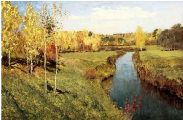
Левитан. «Золотая Осень». Помогает рабочим завода «Химпром» снять стресс во время обеденного перерыва и после смены.