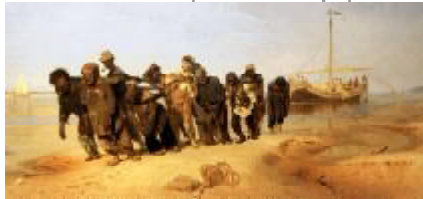
«Бурлаки на Волге», художник И.Е. Репин (1844 - 1930)

Сколько тысяч промышленных автоматов в стране (Газета «Деловой вторник» за 29 октября 2002г. и за 28 октября 2003 года)