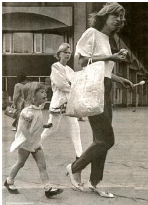
Рис. 48 Не дали мороженого

(Почему в России Люди в детстве мечтают стать продавцами мороженого)