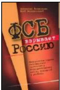
Книга Александра Литвиненко