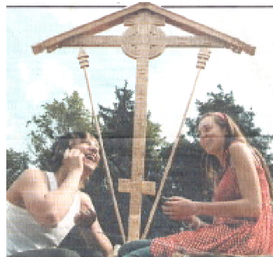
Август 2007-го. У креста в Бутове, где 70 лет назад шли массовые расстрелы.

Значит, все еще может повториться. Впрочем, одно различие между людьми теми и нынешними все же есть: мы -- знаем. Знаем и должны помнить. На эту память вся надежда. Гузель АГИШЕВА «Труд», 30 августа 2007 г.