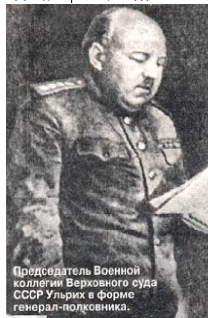
Председатель Военной коллегии Верховного суда СССР Ульрих в форме генерал-полковника.

За два года - с октября 1936 года по сентябрь 1938 года в Москве и на выездных сессиях в 60 городах СССР Ульрих, «любитель бабочек», вынес 30 тысяч 614 смертных приговоров. Не считая тех, по которым невинных гнали в лагерь.