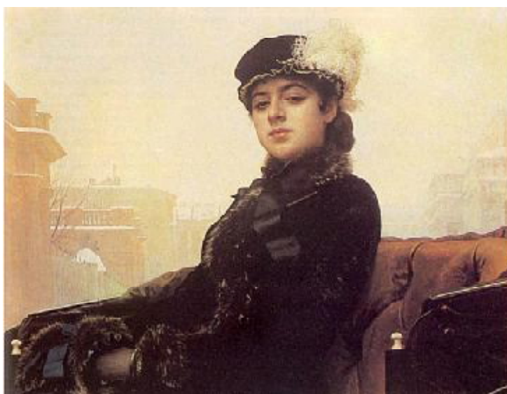
1."Содержанка" Художник Крамской 2."Неизвестная" 3."Незнакомка".

Взгляните "Содержанку", например. - (Крамского): 456 Там – дама на пролётке. Фон – массив домов. У дамы – чётко, (от эффекта от такого), Черты – (на первом плане) без полутонов.