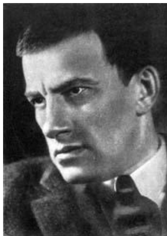
В.В.Маяковский Настоящий Человек Рис. 1