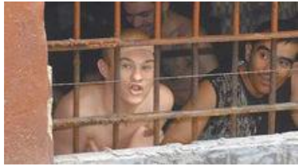
Пациенты Матросской Тишины

Тема «островка» в ходе экскурсии всплывала неоднократно. По словам сопровождающих, иные