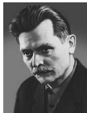
Яшин Александр (1913 - 1968), поэт Рис.127

Да нарастал, как ветер с моря 915 К Бездумной праздничности строк Читательских аудиторий Неотвратимый холодок. (Александр Яшин)