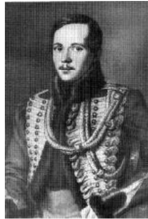
Михаил Юрьевич Лермонтов 1814-1841