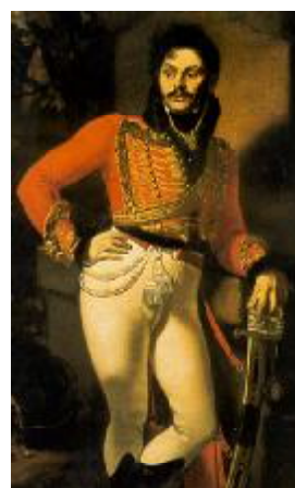
Портрет лейб-гусарского полковника Д.В.Давыдова. 657 Художник О.А.Кипренский

И бабушка, я помню, объясняла это: “Кутили много все гусары” – лишь в стихах ! А вечно при гусаре – сабля, пистолеты,- И воспитанье! К Родине - Любовь , - не страх !