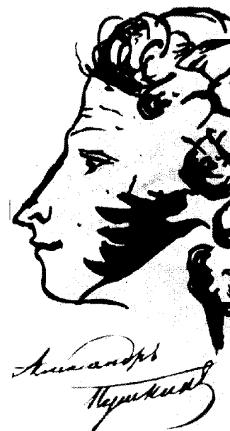
Автопортрет А.С.Пушкина. 1826г.

“...Дай Бог, чтоб милостию неба Рассудок на Руси воскрес, Он, что-то, кажется, исчез...”