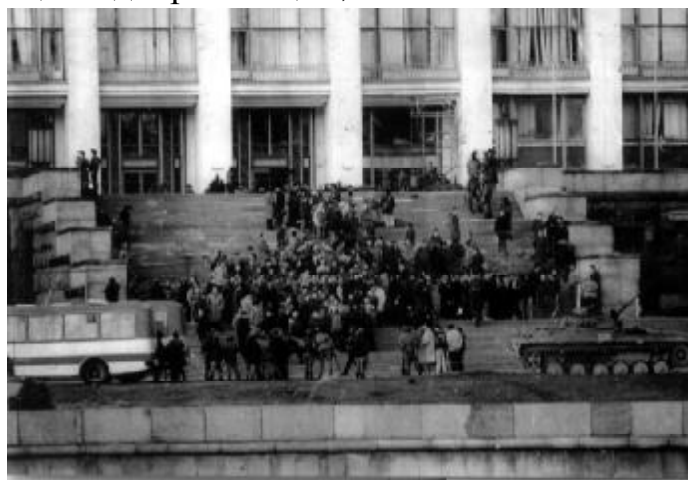
Выход ПОРТОСовцев и других защитников Верховного Совета вместе с депутатами Верховного Совета из Белого Дома 4 октября 1993 года, 16 часов вечера.

Команда прозвучала “За – пе – вай!” - и песню 571 Запели 20 глоток под ружейный треск. Над головами – трассы пуль, (над Красной Пресней!) Вот – “Комсомольцы – добровольцы”, - в злобный век!