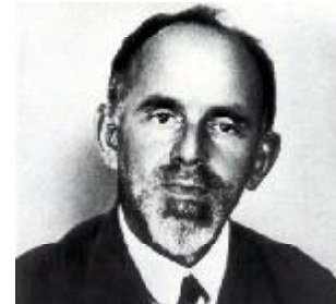
Осип Эмильевич Мандельштам (1891-1938) Русский советский поэт

Его толстые пальцы, как черви, жирны, А слова, как пудовые гири, верны, Тараканьи смеются усища, И сияют его голенища. 448