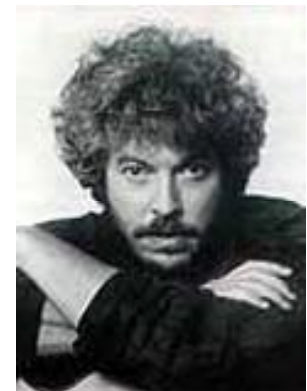
Андрей Макаревич Поэт, композитор, певец, руководитель ансамбля «Машина времени»

Певцам, поэтам, бардам – Партию б скорее 440 Создать всем вместе – и в Политику – вперёд! Владеют мыслью, слогом “Бунтари - Андрей”, В Идее “Там, где Свет” - нуждается Народ!!!