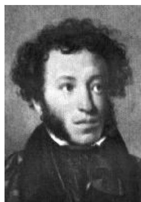
Пушкин Александр Сергеевич (1799-1837), Великий Русский Поэт