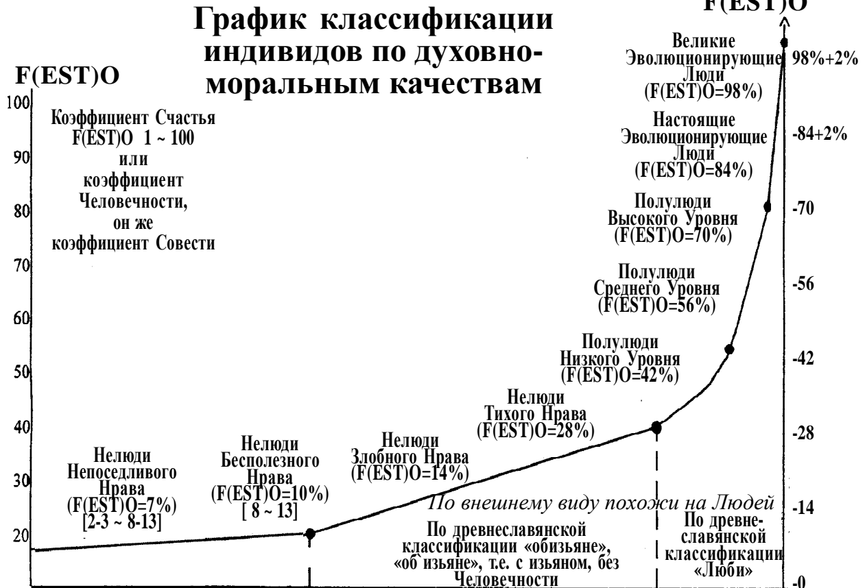
Таблица 1 F(EST)O