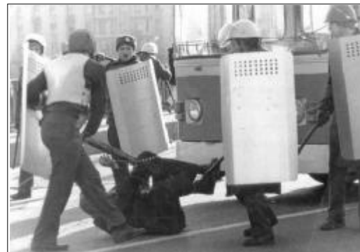
Наемные солдаты продавшихся полков