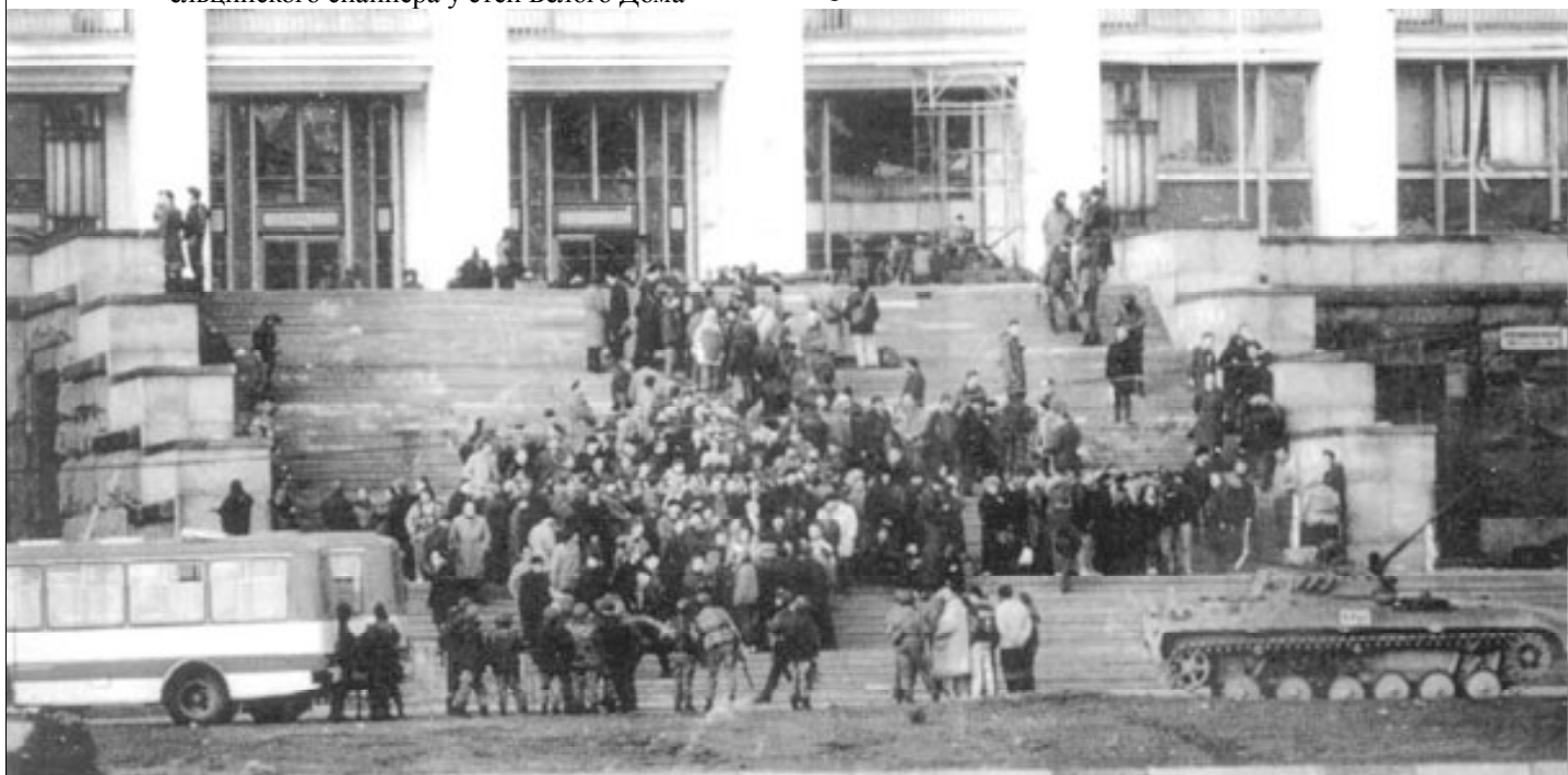
4 октября 1993 г. 18.00. Группа «Альфа» освобождает защитников Конституции и законности. На верхних ступеньках центрального входа горящего Белого Дома - бойцы отдельного взвода Пропанды и Агитации Б.К.Н.Л.-П.О.Р.Т.О.С.

Данкэн Терри Майкл (штат Луизиана, США) (1967-1993 гг.) Пал смертью храбрых 3 октября 1993 г. у телецентра Останкино, вынося из под обстрела раненых граждан Руси